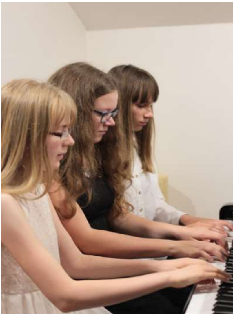
Ze soutěže Múzy Ilji Hurníka