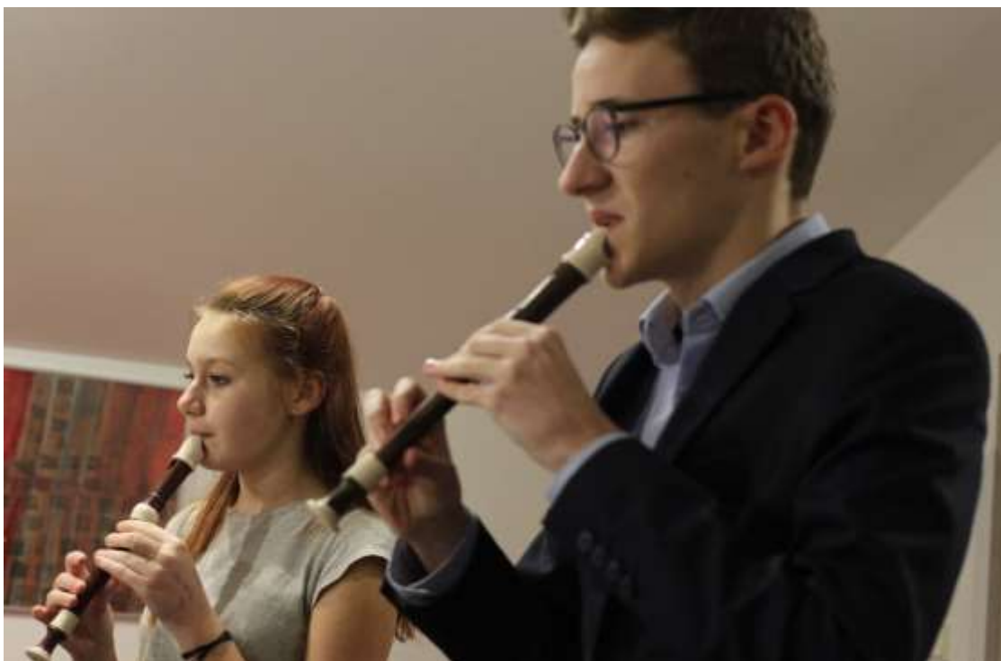
Z vystoupení Barokního souboru, který získal 2. cenu v ústředním kole soutěže v Jindřichově Hradci.