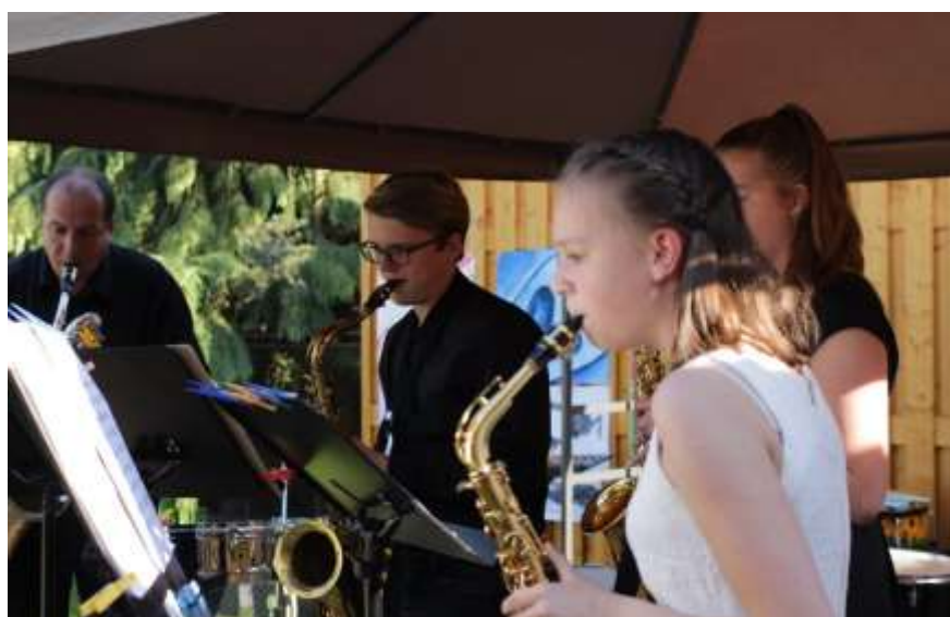
Dokumentární fotografie ze Zahradní slavnosti v rámci ZUŠ Open 2019