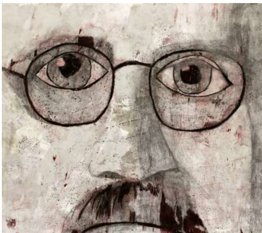
Jedna z prací oceněných medailí z mezinárodní výtvarné výstavy Lidice.